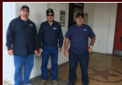
El equipo del Distrito 4 en el Texas Theatre en Jefferson Blvd.

Uno de los compromisos de la Comisionada Garcia es trabajar con otros municipios. En Marzo, el equipo de Caminos y Puentes del Distrito 4 se ofreció como voluntario para ayudar en el Big Event de Grand Prairie por segunda vez desde el inicio del proyecto en el 2018. Este año, 1,800 voluntarios trabajaron en 80 sitios de trabajo en Grand Prairie ayudando a otros en necesidad. En total, se recolectaron 12.56 toneladas de escombros y basura en los esfuerzos para ayudar a embellecer la Ciudad de Grand Prairie. Además, después de una gran tormenta en Julio en el área de Dallas, el equipo de Caminos y Puentes del Distrito 4 se ofreció como voluntario en la limpieza de las calles Jefferson Blvd. y Sunset St. en Oak Cliff con la organización Jefferson Boulevard Alliance.