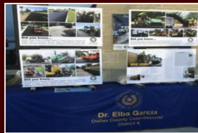
El equipo de Caminos y Puentes del Distrito 4 en el Big Event de Grand Prairie